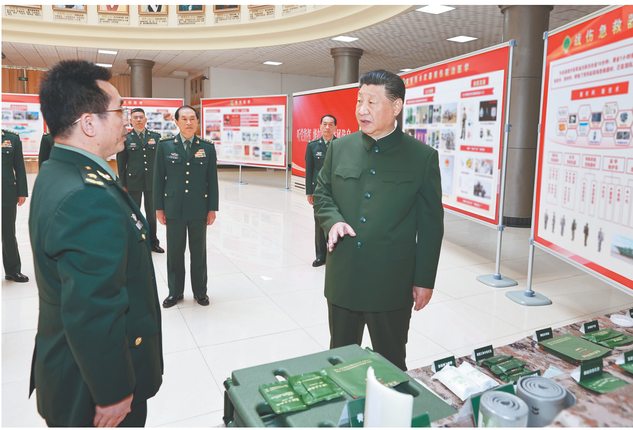
4月23日,中共中央总书记、国家主席、中央军委主席习近平到陆军军医大学视察。这是习近平察看战伤急救器材和学员操作演示。

新华社重庆4月25日电(记者梅常伟)中共中央总书记、国家主席、中央军委主席习近平4月23日到陆军军医大学视察,强调要深入贯彻新时代强军思想,全面落实新时代军事教育方针,面向战场、面向部队、面向未来,提高办育人水平和卫勤保障能力,努力建设世界一流军医大学。