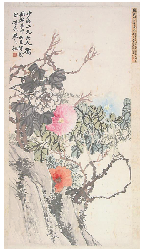
展览中展出的赵之谦《牡丹图》。