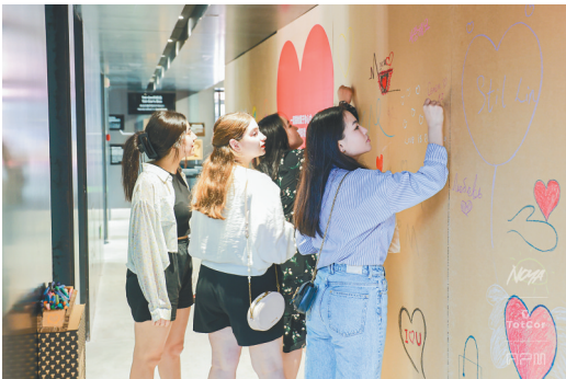
观众在留言墙上签名。

近年来，海口多家新建艺术馆和美术馆悄然“嵌入”闹市区商圈里，它们共同打造了城市里新型的艺术空间，为城市文化生活增色添香。