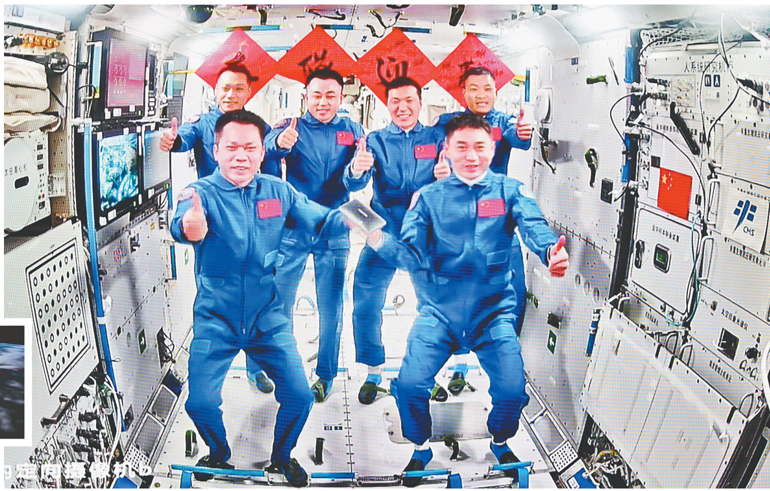
4月26日在北京航天飞行控制中心拍摄的神舟十七号航天员乘组和神舟十八号航天员乘组“全家福”。 新华社发