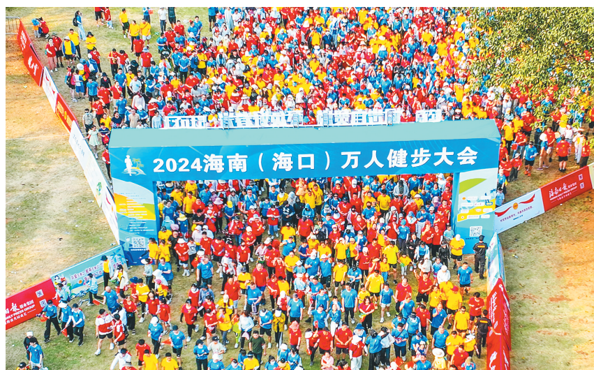
4月27日,2024海南(海口)万人健步大会在海口白沙门公园开跑,近万名市民游客迎着朝阳出发。