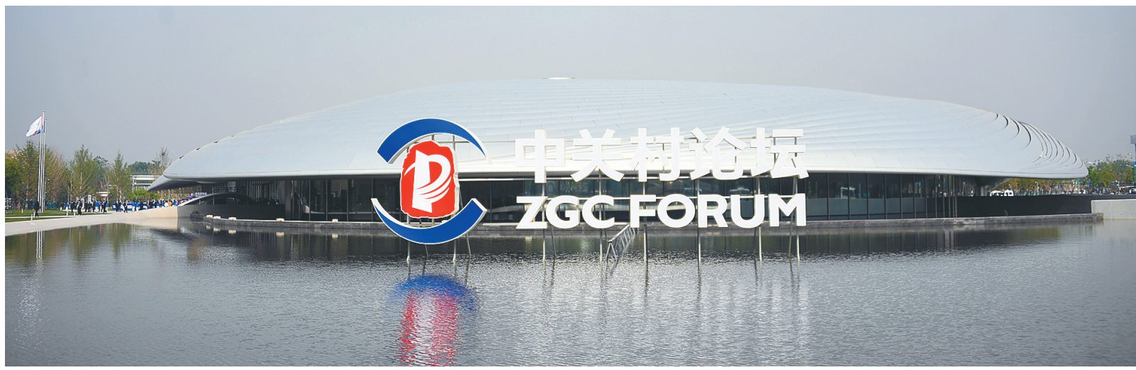
4月25日拍摄的中关村国际创新中心外景。

又是一年春好处。4月25日，2024中关村论坛年会开幕。北京向世界敞开创新合作的大门，迎接来自100多个国家和地区的 innovators。