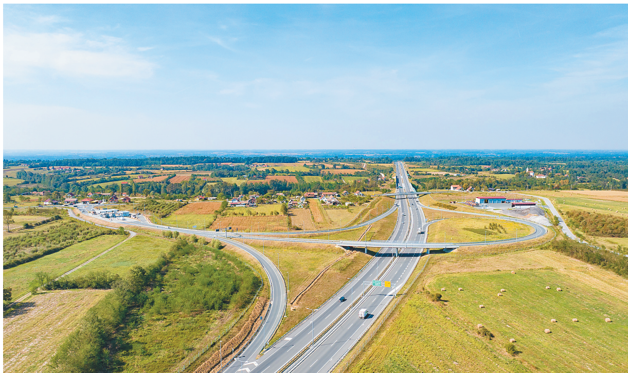
图为2023年9月13日在塞尔维亚乌布附近拍摄的由中企承建的塞尔维亚E763高速公路路段。

势。在法国尼斯，习近平主席收到马克龙总统赠送的法文古籍《论语导读》。在中国广州，习近平主席邀请马克龙总统观赏品茗，共赏千年古琴演奏的古曲《高山流水》。作为东西方文明的重要代表，中法两个文明大国不断拓展多领域的文化合作，是不同文明交流互鉴的生动例证。