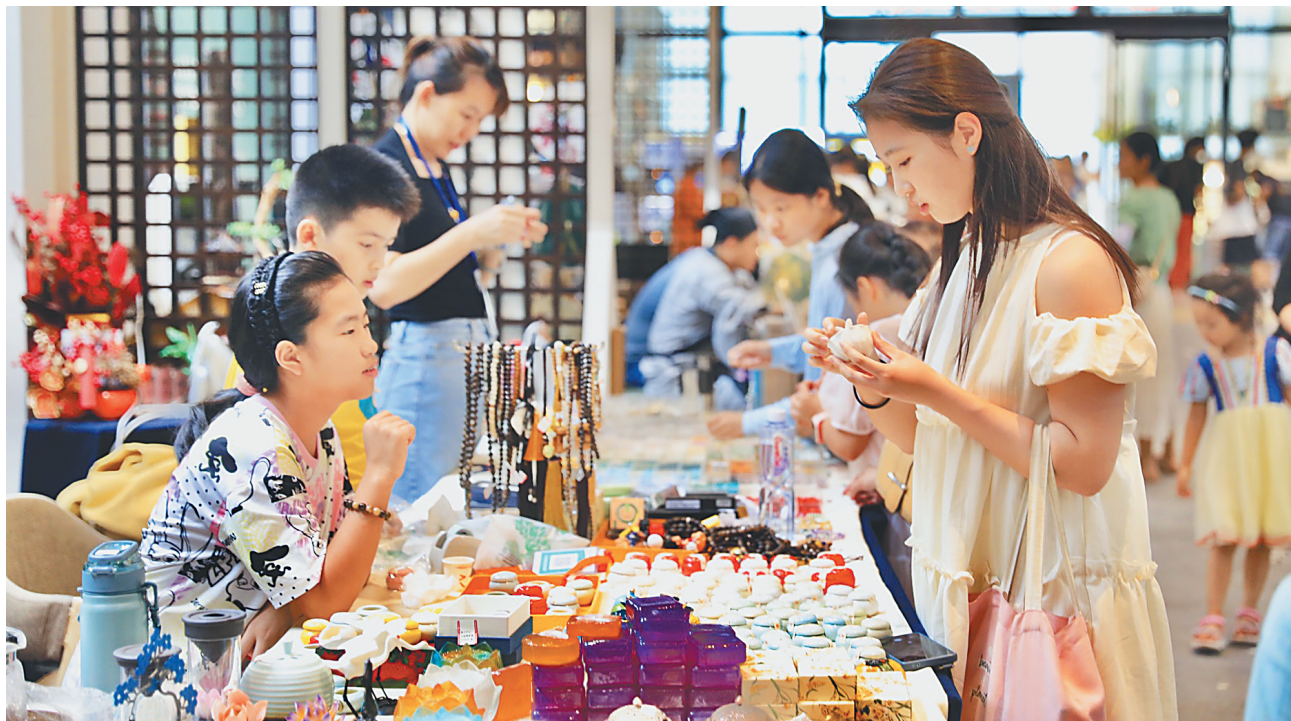
5月1日,观众在省博物馆文创集市上选购商品。“五一”小长假期间,省博物馆策划推出了一系列形式多样的陈列展览和主题活动,丰富游客假日生活。