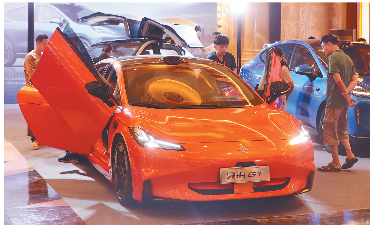
5月2日，2024海报集团海口惠民车展在海南国际会展中心开展，市民竞相逛展看车。

汽车消费作为社会经济的重要组成部分，其持续健康发展对于推动内需增长、促进消费升级具有积极的作用。据介绍，本届车展是海报集团为贯彻落实扩大内需战略规划纲要、助力海南自贸港建设的重要举措，旨在引领车市消费升级，惠及广大消费者。