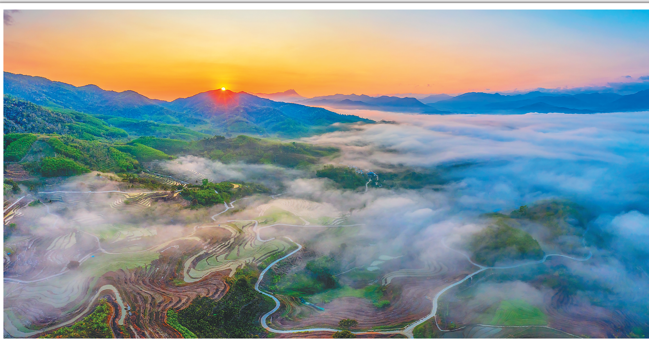
晨光中的五指山牙胡梯田。