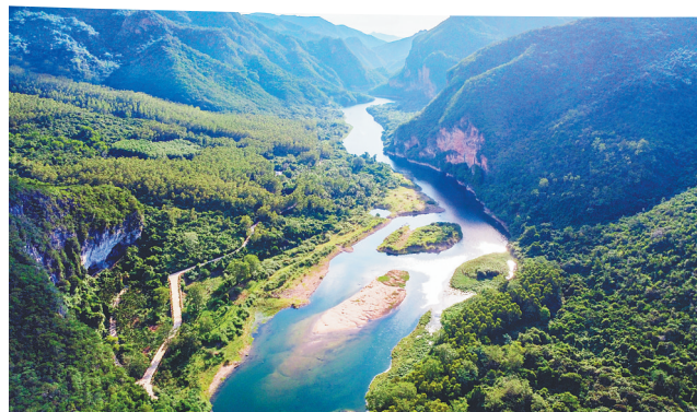
昌江黎族自治县南尧河谷“十里画廊”。