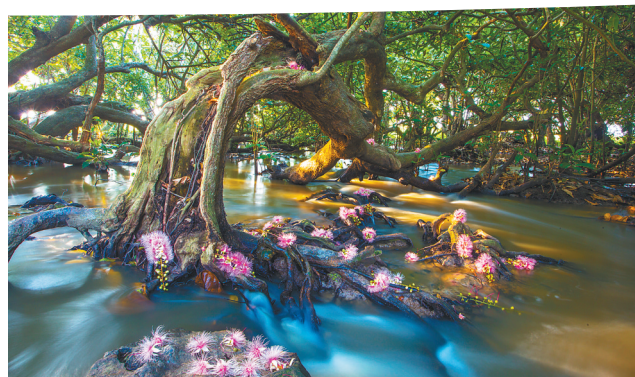
儋州市中和镇七里村玉蕊花开。