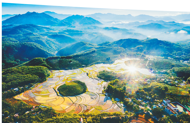
海南梯田景观。高克华 摄