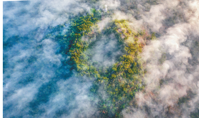
俯瞰海口火山口。