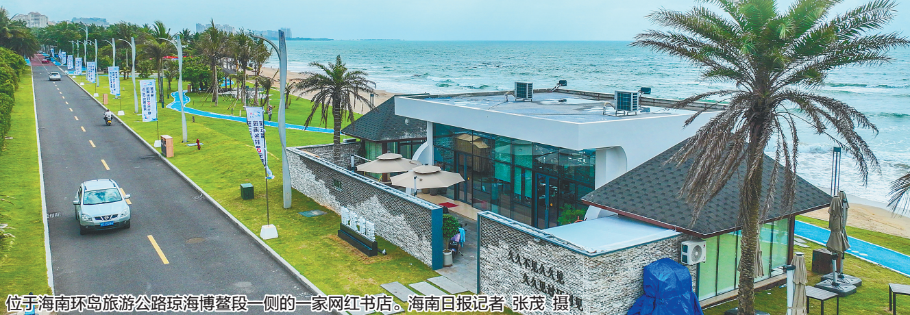
位于海南环岛旅游公路琼海博鳌段一侧的一家网红书店。