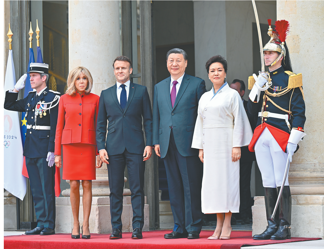
当地时间五月六日下午,国家主席习近平在巴黎爱丽舍宫同法国总统马克龙举行会谈。

习近平强调,中法都是文化大国,双方要加快人文交往“双向奔赴”,以互信消除风险,将中欧打造成彼此经贸合作的关键伙伴、科技合作的优先伙伴、产业链供应链合作的可靠伙伴。中方将自主扩大电信、医疗等服务业对外开放,进一步开放市场,为包括法国和欧洲企业在内的各国企业创造更多市场机遇。