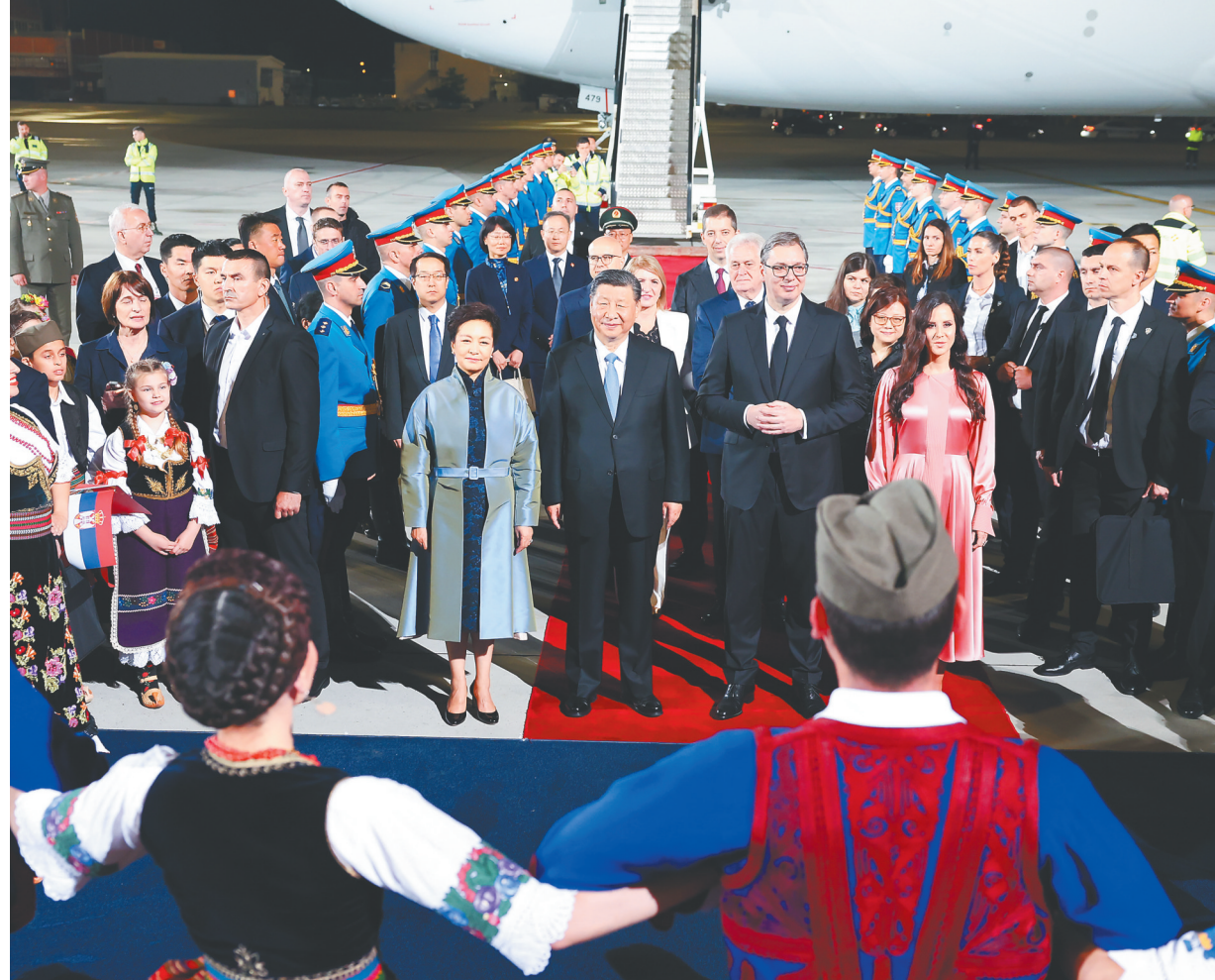
当地时间5月7日晚,国家主席习近平乘专机抵达贝尔格莱德,应塞尔维亚总统武契奇邀请,对塞尔维亚进行国事访问。习近平乘坐专机抵达贝尔格莱德尼古拉·特斯拉国际机场时,塞尔维亚总统武契奇夫妇,对华合作国家委员会主席、前总统尼科利奇夫妇,议长布尔纳比奇,总理武切维奇和外长久里奇等热情迎接。

第一,突出两国关系的战略性,把握双边关系大方向。中方支持塞尔维亚坚持独立自主、走适合自身国情的发展道路,支持塞方维护国家主权和领土完整的努力。 下转 A02 版