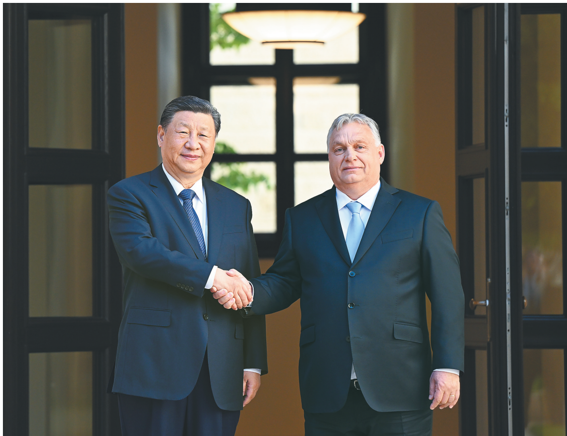
当地时间五月九日下午，国家主席习近平在布达佩斯总理府同匈牙利总理欧尔班举行会谈。

新华社布达佩斯5月9日电（记者倪四义 孙浩）当地时间5月9日下午，国家主席习近平在布达佩斯总理府同匈牙利总理欧尔班举行会谈。两国领导人宣布，将中匈关系提升为新时代全天候全面战略伙伴关系。习近平指出，当前，中匈关系正处于历史最好时期。中匈全面战略伙伴关系保持高水平发展，两国政治互信不断加深，各领域合作取得丰硕成果，树立了构建新型国际关系的典范。今年是中匈建交75周年，中匈关系发展迎来新的重要契机。两国要继续做互帮互助的好朋友、合作共赢的好伙伴，以建立新时代全天候全面战略伙伴关系为契机，为两国合作注入新的强大动力，为两国人民开