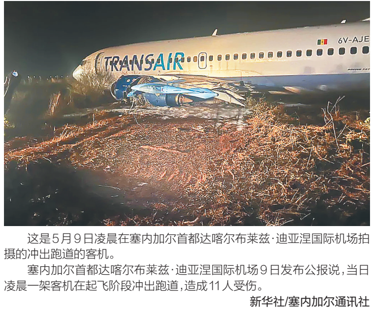
这是5月9日凌晨在塞内加尔首都达喀尔布萊茲·迪亞涅国际机场拍摄的冲出跑道的客机。塞内加尔首都达喀尔布萊茲·迪亞涅国际机场9日发布公报说,当日凌晨一架客机在起飞阶段冲出跑道,造成11人受伤。