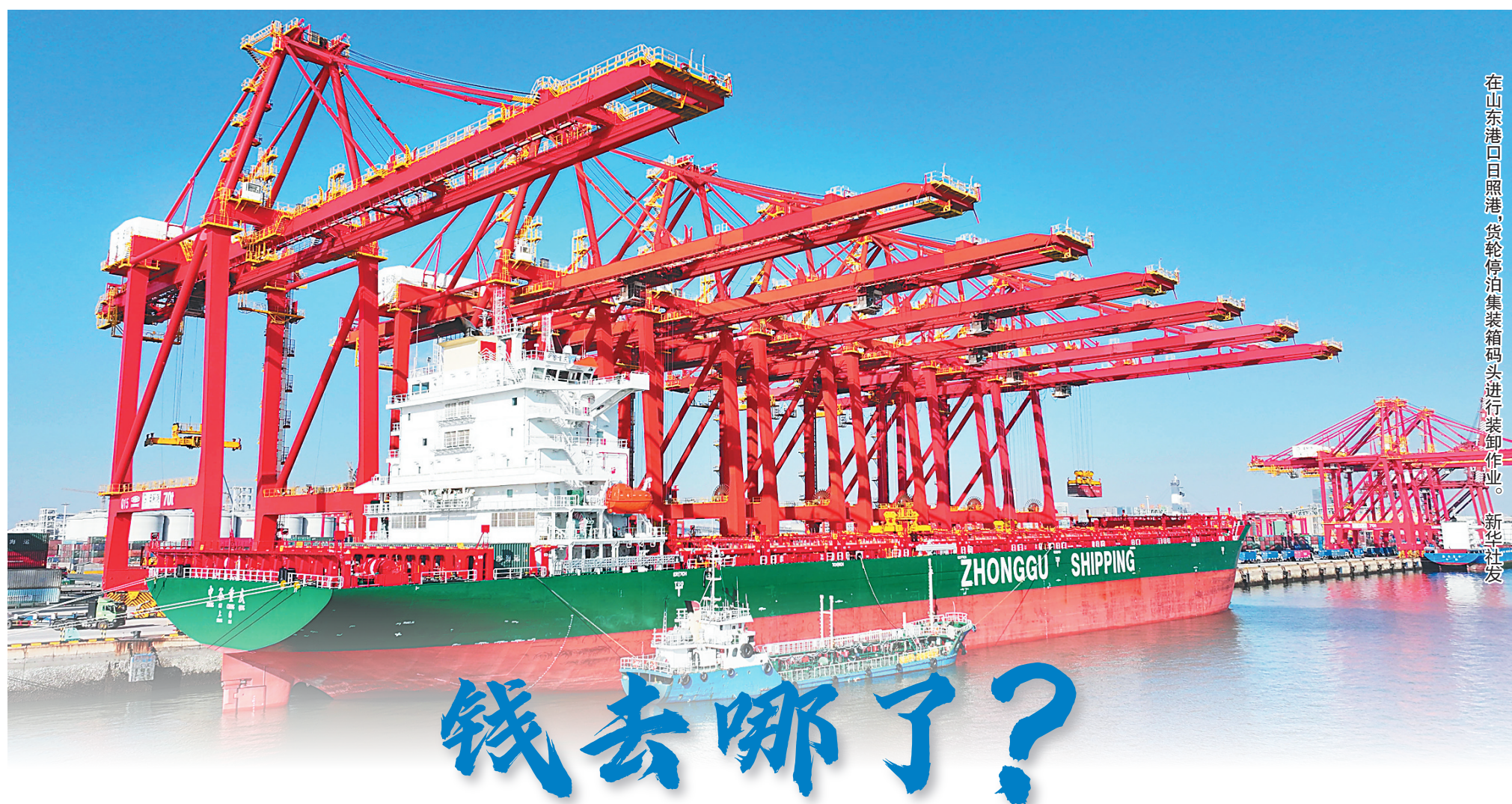
在山东港口日照港，货轮停泊集装箱码头进行装卸作业。

“目前有约19%的6至17岁青少年、约10.4%的6岁以下儿童超重和肥胖。”中国工程院院士、中国疾控中心主任沈洪兵介绍，肥胖是糖尿病、肿瘤、骨关节炎等多种慢性病的重要危险因素，与维持健康正常体重人群相比，超重肥胖人群的心血管事件发生风险升高122%。