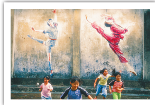
二〇二一年中国共产党成立一百周年之际，市民在海口湾观看文艺汇演。 琼海市阳江镇，几位小朋友在红色娘子军壁画下奔跑。