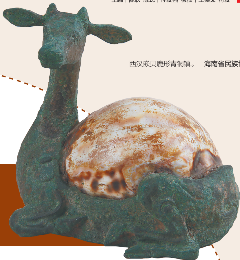
西汉嵌贝鹿形青铜镇。 海南省民族博物馆藏

虎斑宝贝对于我们海南人来说并不陌生，算是南海海域的特产贝类之一。这种极具装饰性的海贝因其美丽的外表，曾与两千多年前的青铜有过邂逅，铜与贝的组合产生了嵌贝青铜镇这类独特的青铜器，成为海洋文化和青铜文化碰撞后的结晶之一。