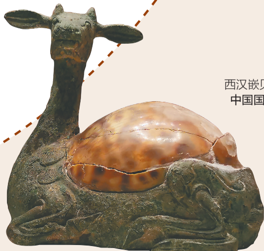
西汉嵌贝鹿形青铜镇。 中国国家博物馆藏