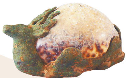
西汉嵌贝鹿形青铜镇。 台北故宫博物院藏