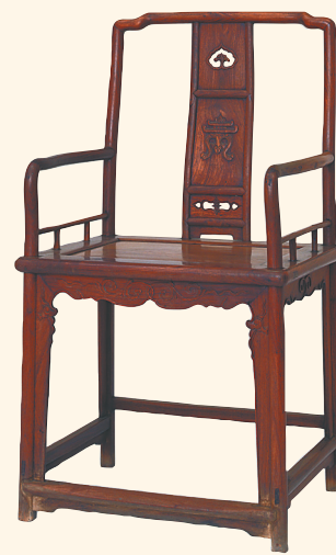
黄花梨木椅。