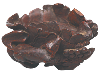
沉香木雕葡萄纹洗子。