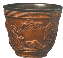
槟榔木镶银里雕人物诗韵套杯。

“这些珍贵的海南特产，不仅仅是物质的瑰宝，更是历史的见证，它们承载着海南黎族、汉族等各族人民千百年来交往交流交融的深厚历史。”周京南说。