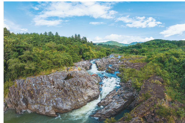
三亚南岛瀑布。

守护好家园的一草一木,让尊重和保护的初心成为一种自觉,把对万物生灵的热爱当成一种行动,让天蓝地绿水清的生态之美成为天涯常态之美。