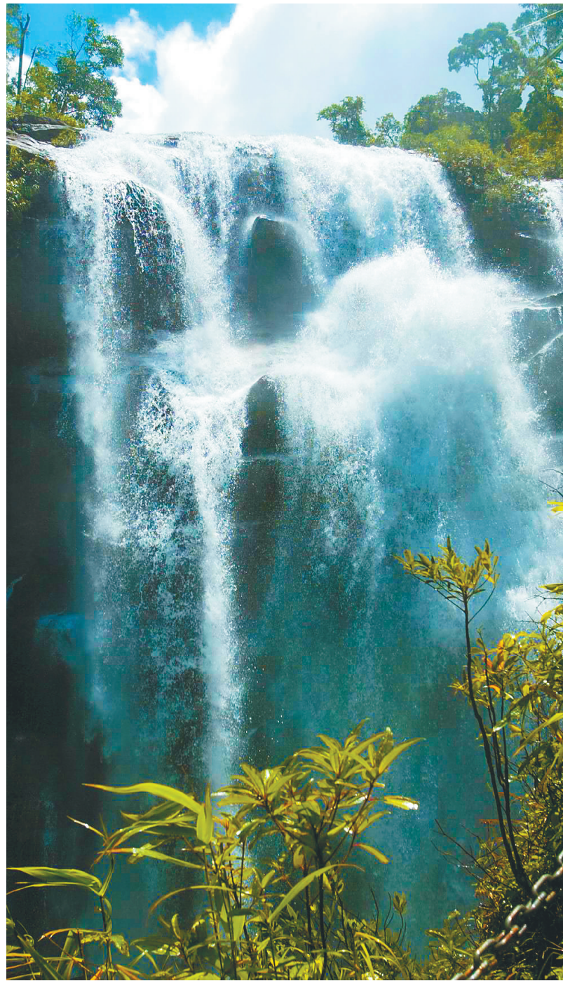
陵水吊罗山枫果山瀑布。