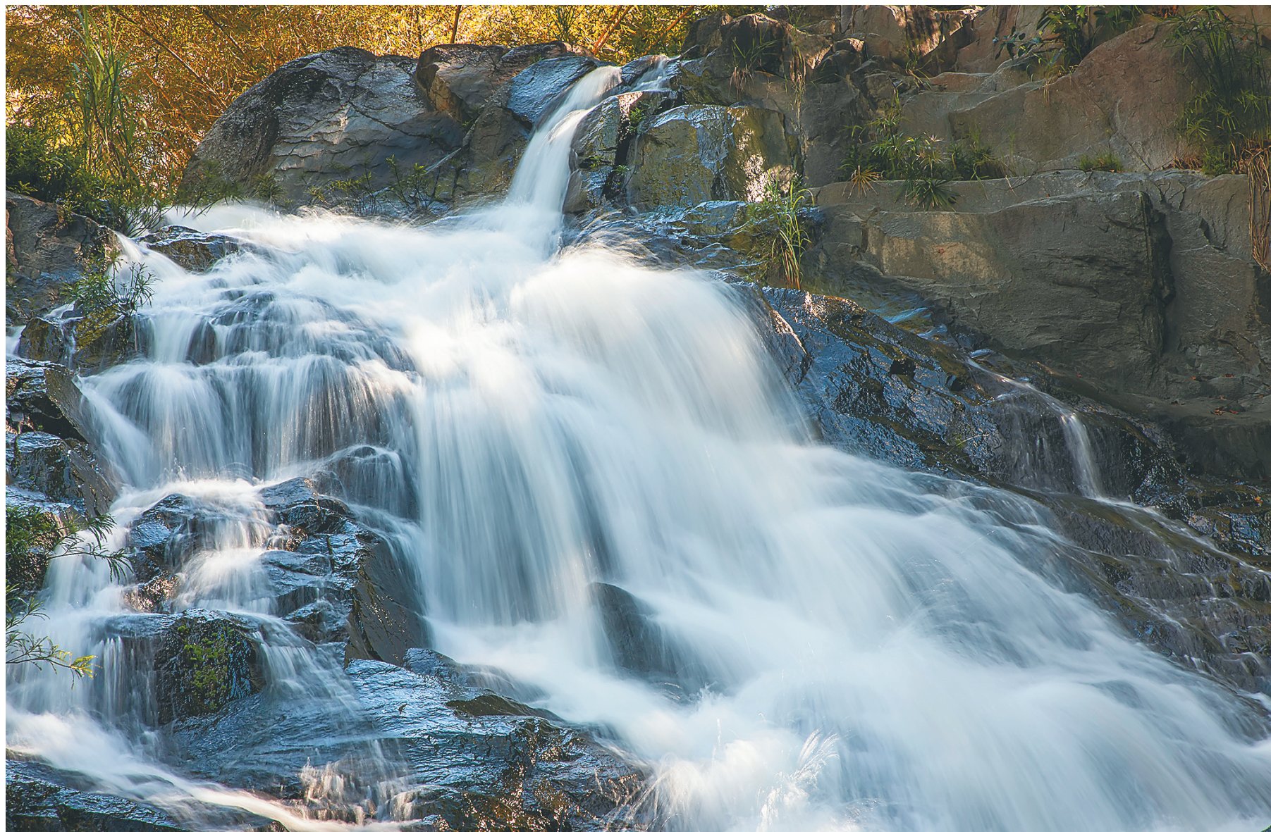
五指山太平山瀑布。