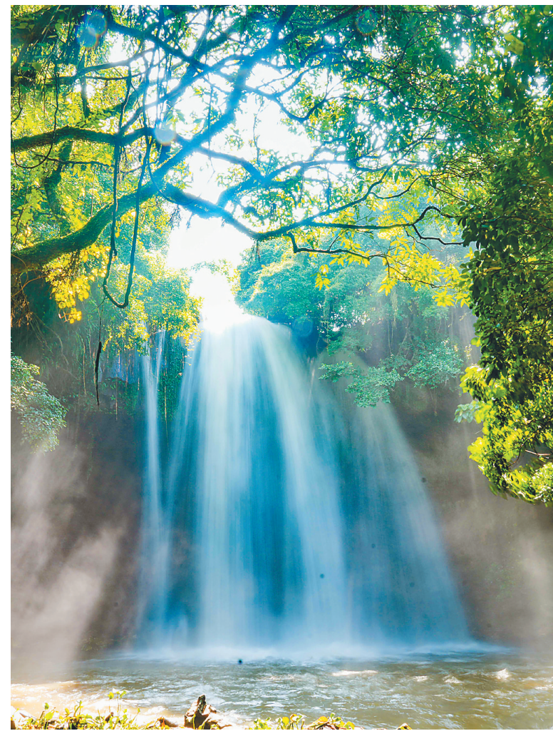
临高古银瀑布。