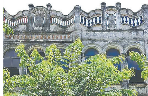
儋州市王五镇中山街骑楼一瞥。

继续向北，进入澄迈县金江镇中山东路，建于20世纪30、40年代的街道深处，还能感受到当年骑楼的历史风貌，不过整体质量和风格，已然显得一般。