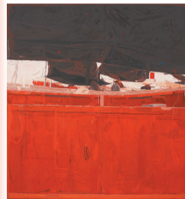
李新赞《修船厂一再造之一NO.20》。