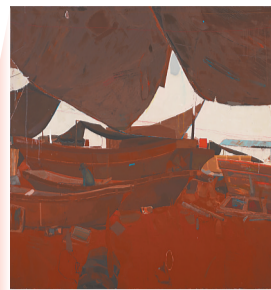
李新赞《修船厂一再造之一NO.13》。