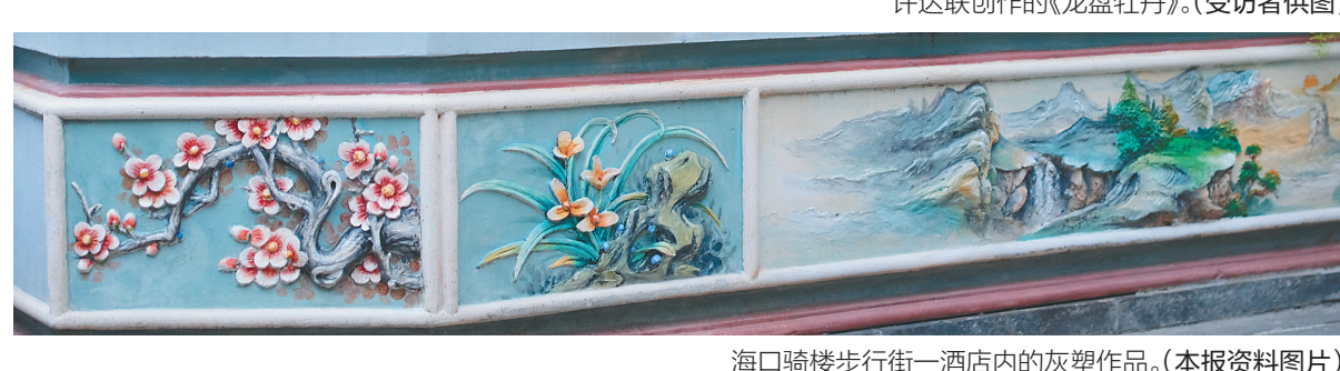
海口骑楼步行街一酒店内的灰塑作品。