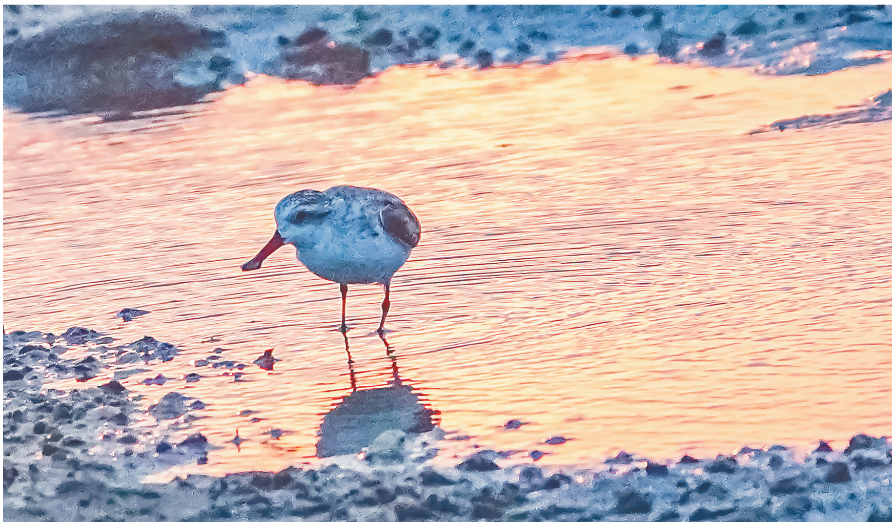
近日，在儋州湾的滩涂上，一只勺嘴鹬在夕阳下觅食。