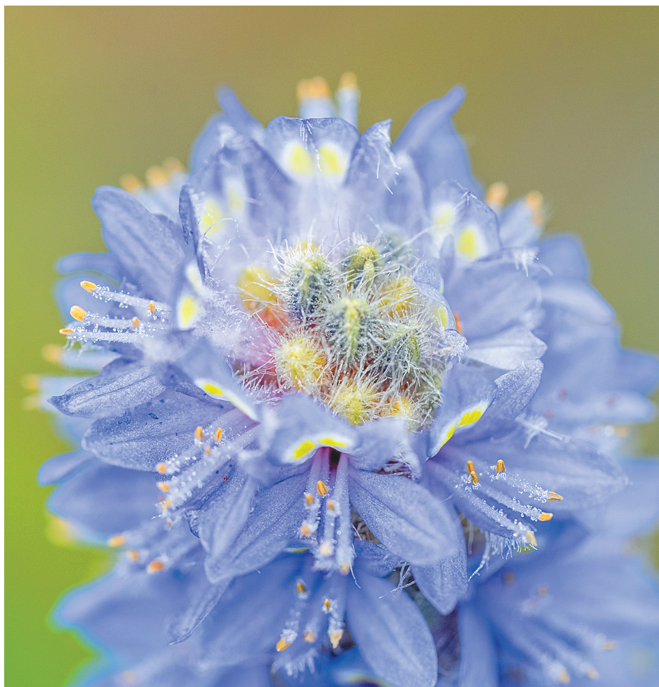
近日，在海口五源河国家湿地公园，梭鱼草的花朵。