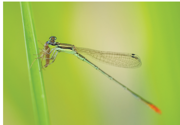
近日，在海口五源河国家湿地公园，褐斑异痣螳在进食。