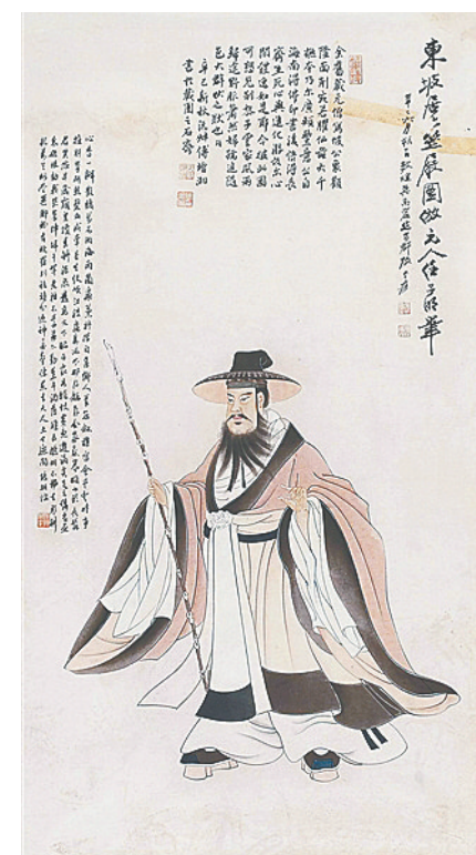
张大千《东坡居士笠履图》。吉林省博物院藏

这首诗从梧州山川环境着笔，进而写途中感受和离合情怀。“九疑联绵属湘衡，苍梧独在天一方。孤城吹角烟树里，落日未落江苍苍。幽人拊枕坐叹息，我行忽至舜所藏。江边父老能言说，白发红颊如君长。”首四句言梧州地形，九疑山(今作“九嵛山”)山势连绵，地属衡湘，而梧州则在更远的地方。孤城的画角(古代乐器名)声回旋在云树间，轻淡的月光使江水显得一片苍苍。浩渺空阔的境界，映衬出诗人孤寂迷茫的心境。接下来的“幽人”句写二人的遭际。“幽人”，出自《易·履》“幽人贞吉”，此处为苏轼自指。“舜所藏”，据《礼记·檀弓上》：“舜葬于苍梧之野”。苏轼连用语典和传说，在叙事写实的同时，也暗含自己情怀高洁和人生飘忽无常之意。“江边”句则巧妙引出弟弟苏辙，借父老之言表