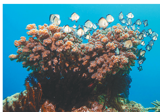
蜈支洲岛海洋牧场，鱼群在珊瑚礁上觅食。