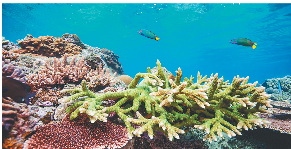
蜈支洲岛海洋牧场热带海洋鱼类在珊瑚礁上觅食。 摄影者在拍摄巨型石斑鱼觅食。