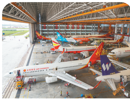
5月17日，海南自贸港一站式飞机维修产业基地机库内停满了待修飞机。

在海南自贸港修飞机更省钱，这样的口碑已逐渐传播开来。自2022年投用以来，一站式基地已完成超1300单飞机维修项目，承接超140架次飞机喷漆业务，维修航空部附件超3万个，其中包括了40多单进境飞机维修及喷漆业务。越南、菲律宾、卡塔尔等国家的航空公司已经成为回头客。