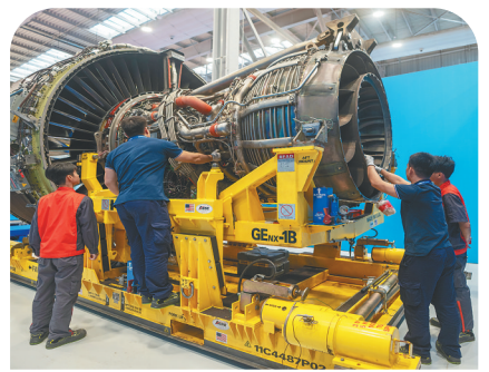
工作人员正在开展海南自贸港首单航空发动机维修业务。