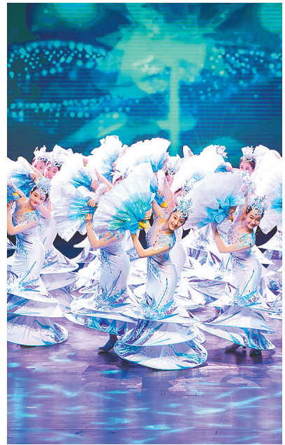
近日，演职人员在第八届中国博览会文艺演出现场进行表演。