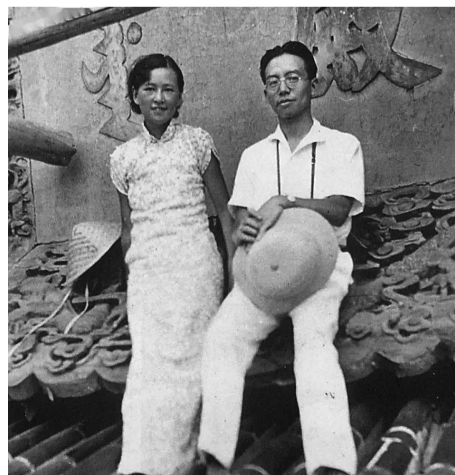
1936年前后，林徽因与梁思成在北平天坛正在修缮的祈年殿屋顶上。