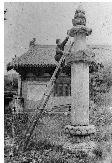
林徽因测量佛光寺经幢。 图片来源：梁思成《中国建筑史》