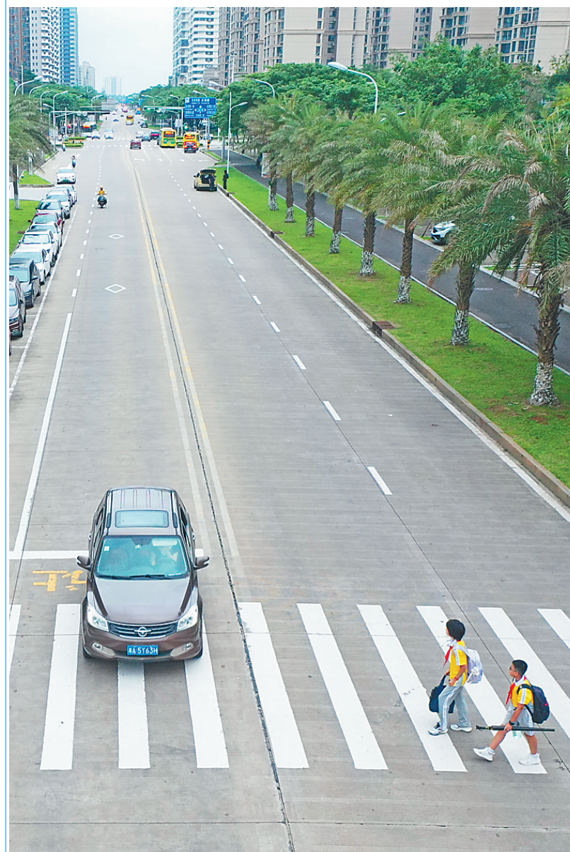
5月22日7时10分,在海口市长滨西二街斑马线上,一辆小汽车没有礼让行人,从过马路的学生身边驶过。