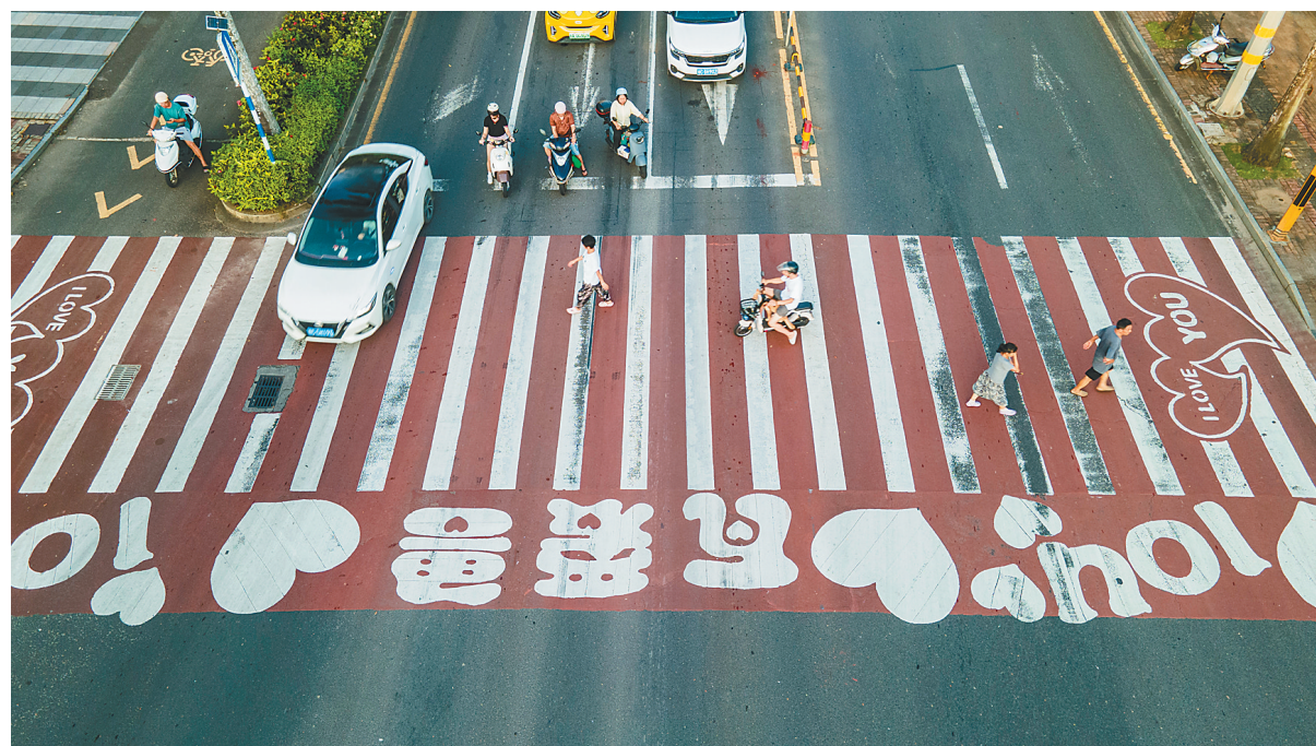
近日,在琼海市喷泉广场,一辆白色轿车与过斑马线行人抢道而行。