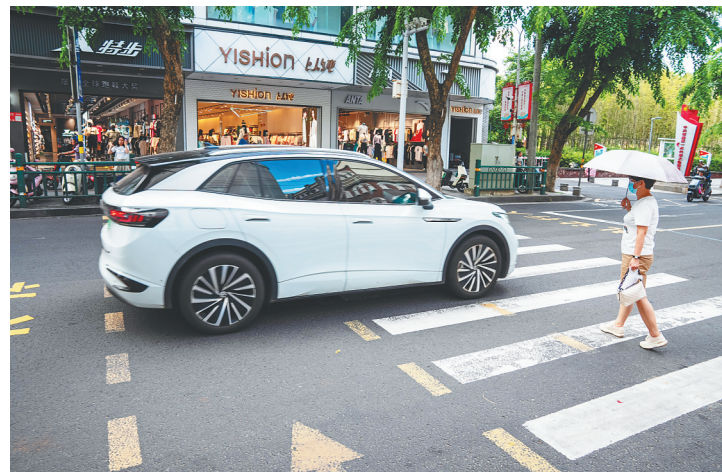
5月27日,在海口市龙华区解放西路,一辆汽车经过斑马线时没有礼让行人。