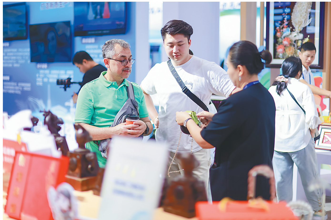
第二十届深圳文博会上，参展商向外国观众展示海南椰雕文创产品。

走过二十年辉煌历程的文博会，既是文化产业高质量发展的重要标志，也是全球文化交流与合作的重要桥梁。通过文博会架设的文化展示之窗、产业交易之桥，海南将持续促进文化创新和繁荣，推动新时代文化建设不断开创新局面。