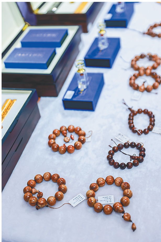
日前，形式多样的海南沉香工艺品亮相文博会。