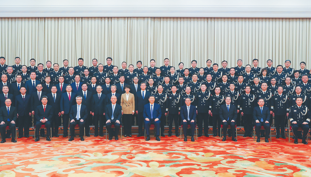
5月28日，党和国家领导人习近平、李强、蔡奇、丁薛祥、李希等在北京人民大会堂会见全国公安工作会议代表。

新华社北京5月29日电 中共中央总书记、国家主席、中央军委主席习近平28日下午在北京人民大会堂亲切会见全国公安工作会议代表，向他们致以诚挚问候，勉励全国广大公安民警辅警奋力推进公安工作现代化，为推进强国建设、民族复兴伟业作出新的更大贡献。