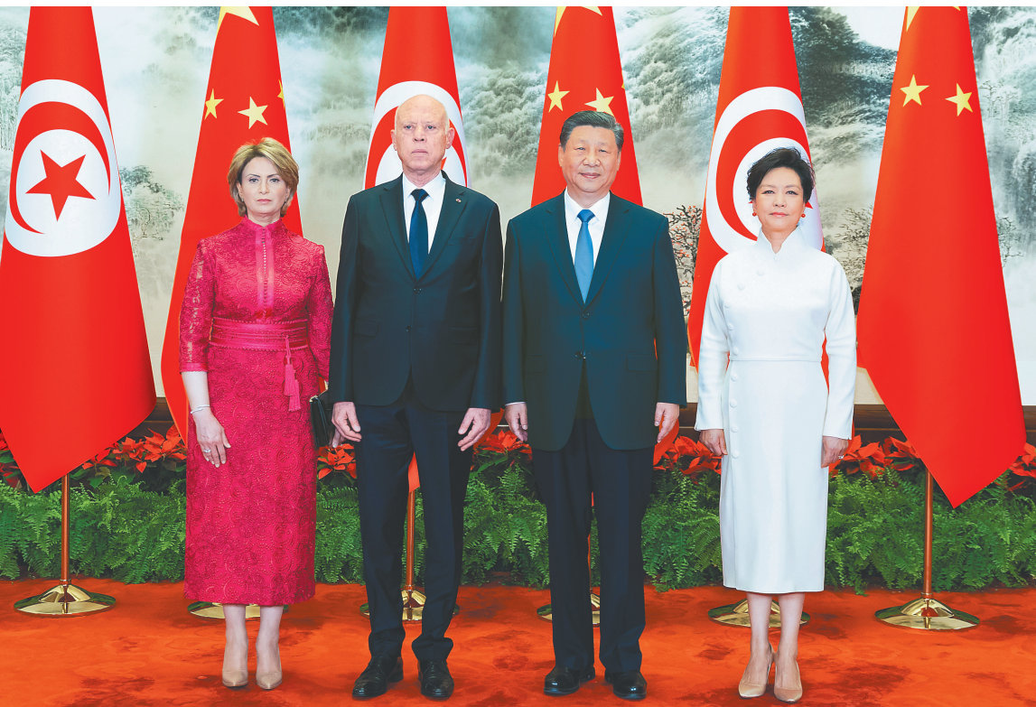
五月三十一日上午，国家主席习近平在北京人民大会堂同来华国事访问并出席中国-阿拉伯国家合作论坛第十届部长级会议开幕式的突尼斯总统赛义德举行会谈。这是会谈前，习近平和夫人彭丽媛同赛义德和夫人伊什拉芙合影。