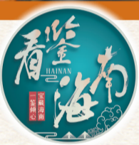
海南日报记者 刘梦晓

6月2日恰逢周末，海口骑楼老街寰海阁酒店门口，不少游客在大门两侧的灰塑门联前打卡拍照。这是一件以“喜鹊报春”为主题的灰塑，一只喜鹊立于枝头，双目炯炯有神。细细观之，喜鹊的绒毛、爪皮，乃至树叶的脉络均清晰可见。