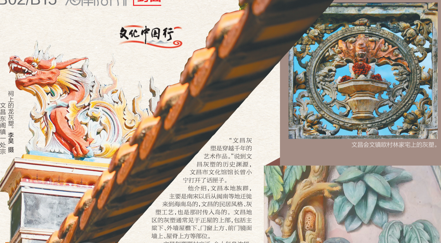
祠上的龙灰塑。