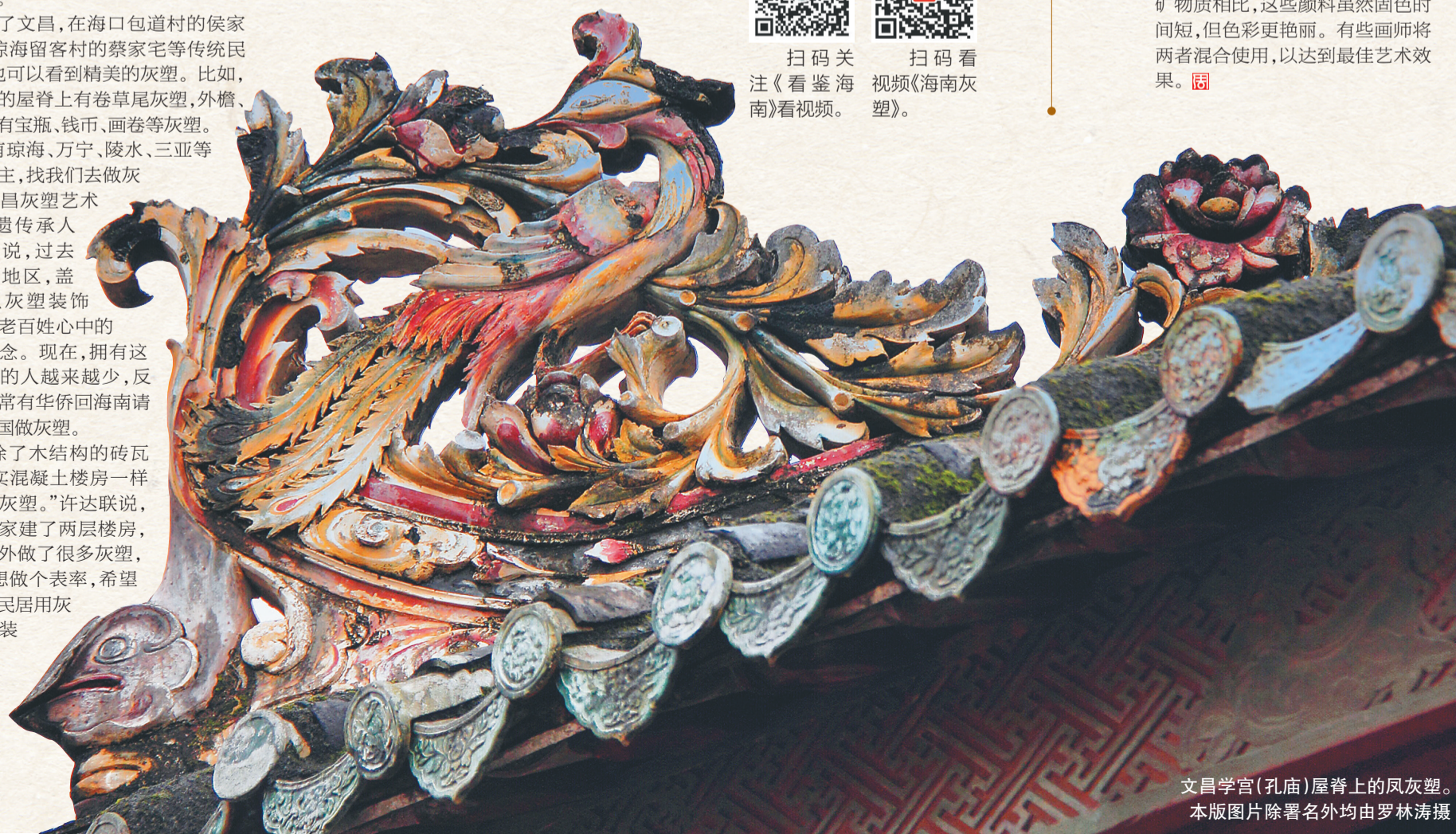
文昌学宫(孔庙)屋脊上的凤灰塑。

上色时，灰塑画师们通常使用的颜料是天然矿物质粉，色彩只有土黄、土红、奶蓝、墨色四种基本色，优点是固色持久，可以保持几十年，甚至上百年。随着工业生产的进步，画师们博采众长，开始尝试使用水彩、丙烯等颜料。与矿物质相比，这些颜料虽然固色时间短，但色彩更艳丽。有些画师将两者混合使用，以达到最佳艺术效果。