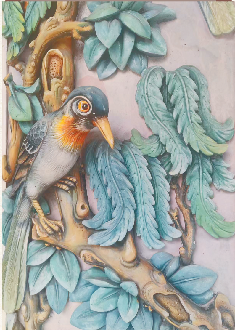
寰海阁酒店灰塑门联上的喜鹊。

文昌灰塑画师陈加飞创作的《泉罗春山秀》，是一幅灰塑山水画。画中的绿树、青山、碧溪等错落有致，霞光由远及近照射，刺破云雾，层次十分丰富。“这幅作品参考了国画的技法，色彩复杂多样，绘制难度很大。”陈加飞说，创作灰塑画的难度不亚于在纸上绘画，难就难在上色。“因为灰塑画是立体的，想要达到晕染、渐变的效果，就要反复叠涂，层层修饰，这很考验画师的功力。”文昌灰塑画师黄心宽擅长山水草木题材，他创作的《山光水色》《深谷晨韵》等灰塑画，描绘出一个鸟语花香的自然胜境，颇受市场欢迎。从凝固的建筑构件，到“行走的艺术品”，灰塑入琼千年，演变出绰约风姿。