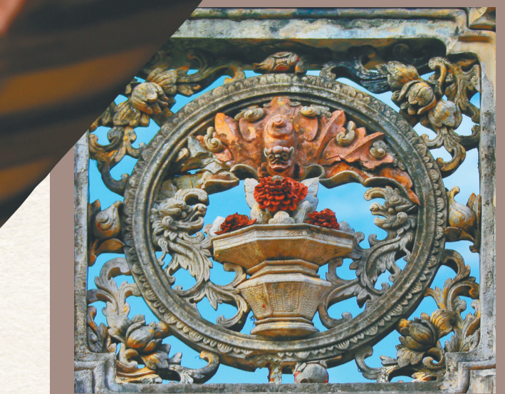
文昌市文镇欧村林家宅上的灰塑。