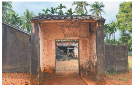
海口市三江镇福山村建于1830年的封氏宗祠旧址。