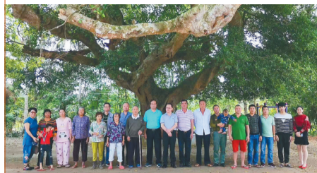
2020年1月,在海口市演丰镇南白村遮天蔽日的大榕树下,部分岛内外封氏族合影留恋。