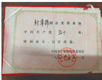
封尊锦于1946年加入中国共产党。