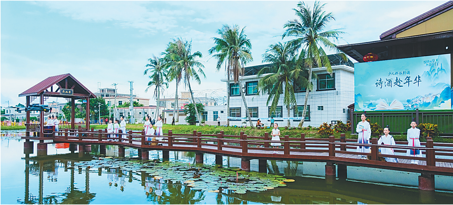
6月8日，万宁市“悦读阅享 向美而行”第二届读书月闭幕式暨这里是万宁·六月主题之曲冲乡村漫读活动上，少儿群体朗诵《诗酒趁年华》表演现场。

据悉，建设前东星高架桥下因拆迁后存在黄土裸露，影响了环岛高铁高速公路沿线环境以及城市美观。建设后，口袋公园有了绿草地、种植了新树，有效覆盖了黄土裸露，进一步改善环岛高铁高速可视范围内的景观环境。同时，还增设休闲座椅等设施，为周边居民搭建起了休憩场所以及绿色健康舒适的休闲活动空间，极大提高了周边居民的生活满意度和幸福感。