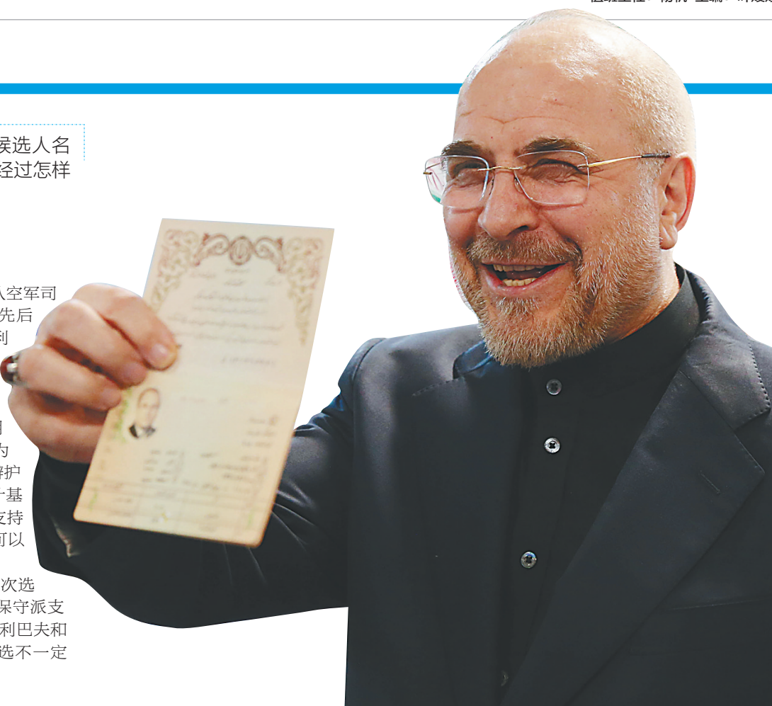
6月3日，伊朗议会议长卡利巴夫在德黑兰参加伊朗总统选举候选人登记。

中国社会科学院西亚北非研究所伊朗问题专家魏亮认为，未来一段时间，有些实力较弱的候选人可能退选并宣布支持其他候选人，这会给选情带来新变数。