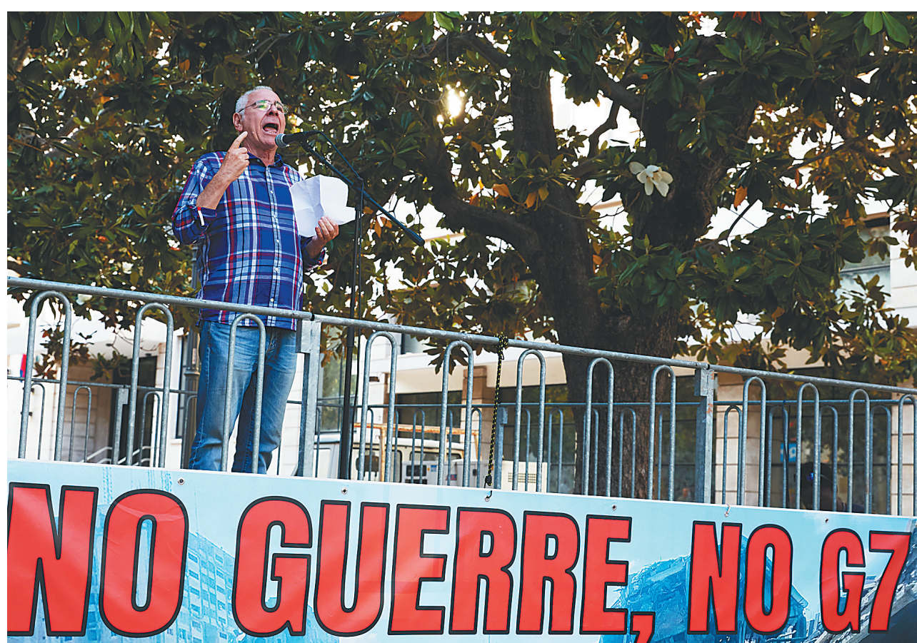
七国集团峰会13日开幕，会场周边地区当天举行多场抗议活动。图为一名抗议者发表演讲抗议七国集团峰会。新华社发