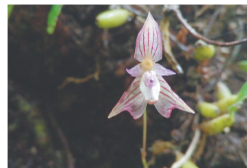
芳香石豆兰。