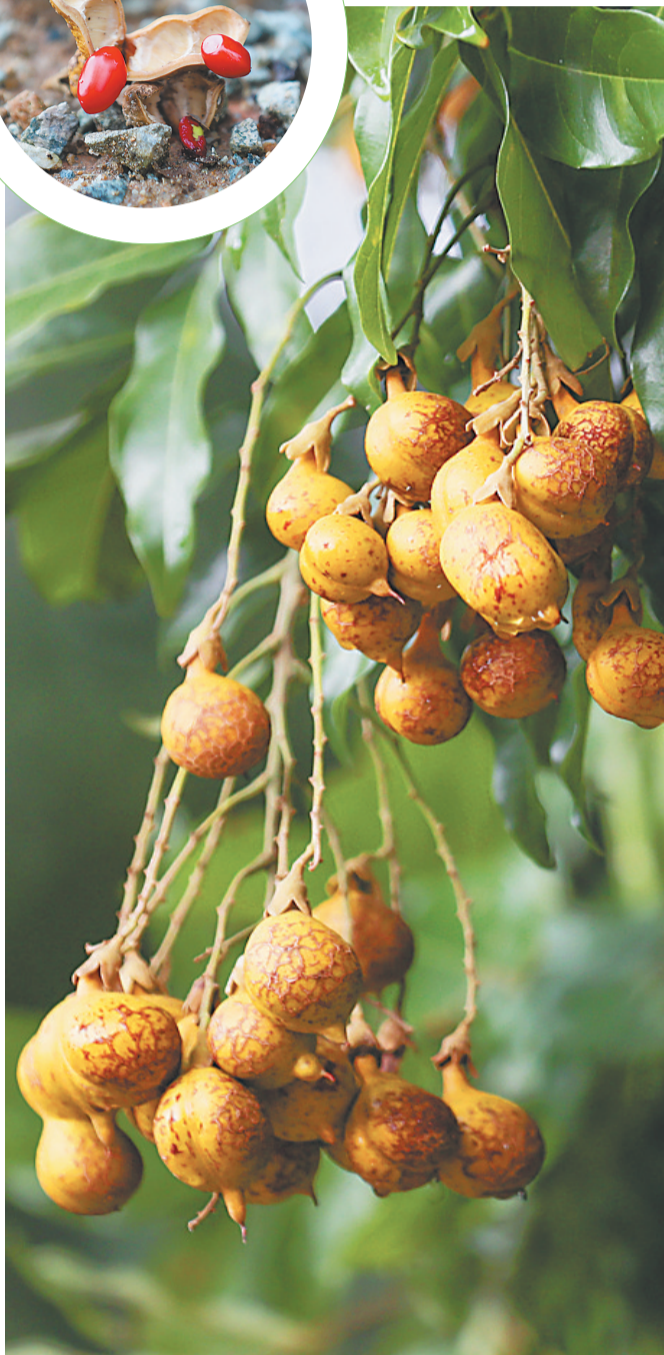
海南省林科院枫木实验林场的海南红豆树挂满果实。