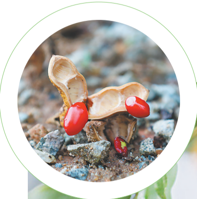
海南红豆树的种子。

除了海南红豆树、酸豆树，海南菜豆树的名气也不小。钟琼芯介绍，海南菜豆树是紫葳科菜豆树属植物，喜欢生长在低海拔坡林地，其扁圆形的荚果长可达40厘米。值得一提的是，它的木材偏硬耐腐，纹理美观，适合用于制作家具，它的根、叶、果均可入药，常用于治疗跌打损伤、毒蛇咬伤等。