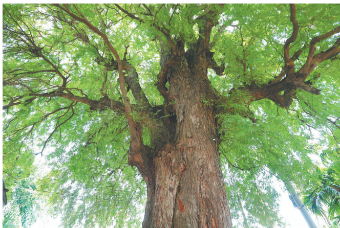
乐东的一棵酸豆树。