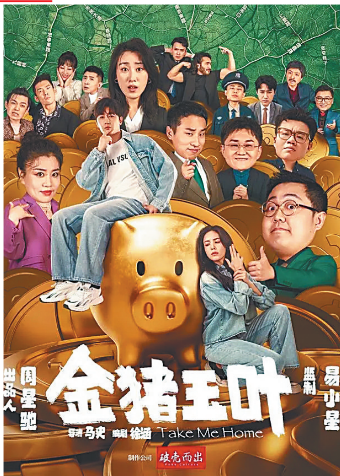
微短剧《金猪玉叶》海报。

新旧媒体之间,并不存在绝对的沟壑,而是会进行媒介融合。按照传播学者麦克卢汉的观点,任何一种新媒介的出现,必然会对旧媒介产生影响,要么是挤占旧媒介的生存空间,要么是倒逼旧媒介产生新的特点。因此,当周星驰遇见微短剧,是“金风玉露一相逢,便胜却人间无数”。事实上,随着近年来的爆炸式增长,微短剧已经逐渐度过了以量取胜、泥沙俱下的野蛮生长阶段,逐渐转型升级,走向了规范化、精品化、创新化的新阶段。诸如周星驰这样大咖级别的导演的人局,无疑会拉高微短剧的整体艺术水平,让微短剧未来有更广阔的发展前景。