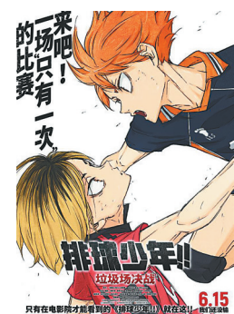
《排球少年! 垃圾场决战》海报。