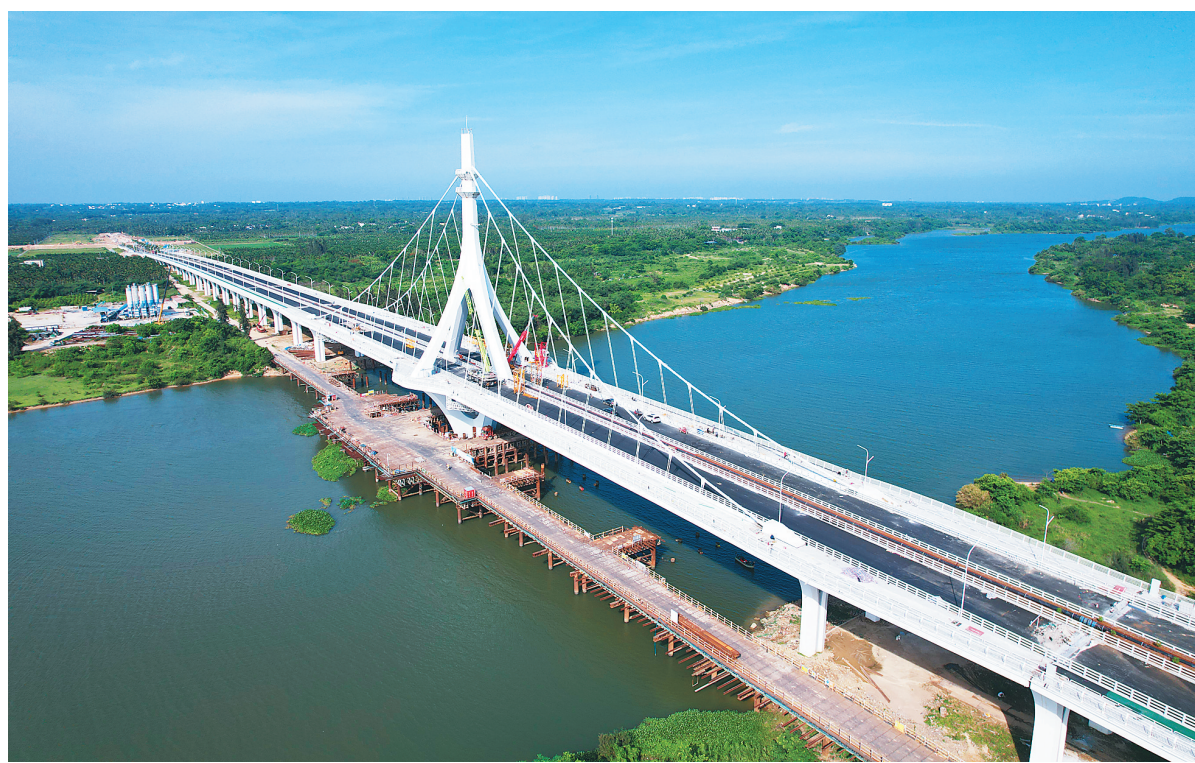
日前,航拍正在建设中的乐城大桥。

记者了解到,为确保如期进行初验,乐城大桥项目部加大了人力、设备等资源配置,稳步推进收尾工作。