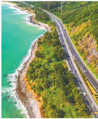
航拍海南环岛旅游公路陵水路段。

今年5月以来，海南各地掀起一阵“摩旅热”：2024年首届海南环岛摩托车文化旅游嘉年华在海口启幕；2024年机车旅游节在屯昌举办……从昔日的代步工具，到如今的文旅新潮流，从小众运动到新晋网红，不仅是摩托车爱好者在海南集结，摩旅产业也在滚滚向前。