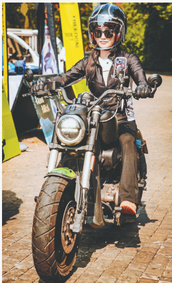
摩旅爱好者在海南环岛旅游公路骑行。