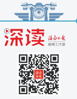
扫码看“摩旅燃”海南岛

执行总监：刘乐蒙 统筹：李国栋 编导：刘乐蒙 文案：刘晓惠 拍摄：陈若龙 剪辑：吴文惠 （部分画面由受访者提供）