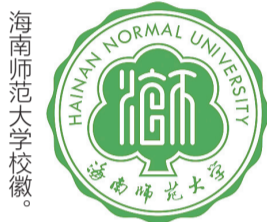
海南师范大学校徽。

“龙昆南校区的大榕树，是学校一道亮丽的风景线。它们扎根大地，吸收阳光雨露，展现出枝繁叶茂、遮天蔽日的旺盛生命力。”海南师范大学一位职工说，多年来，学校师生喜欢在大榕树下乘凉、晨读、聊天，“大