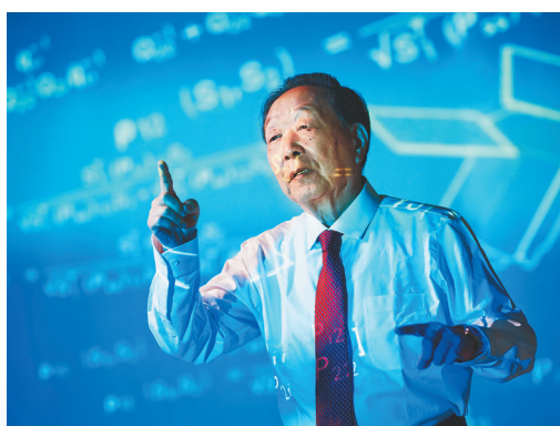
2024年5月13日在武汉大学拍摄的李德仁肖像。

在武汉大学,有一门被学生们誉为“最奢侈的基础课”,由李德仁等6位院士联袂讲授。李德仁坚持按时给大一学生讲授“测绘学概论”。这门有28年历史的基础课程,每次都座无虚席。“未来世界科技的竞争,关键是人才竞争。”李德仁认为,要把测绘科学能为国家“干什么”、学科能达到的“高度”告诉学生,引导他们主动思考、勇于攀登。2024年5月,“珞珈三号”科学试验卫星02星顺利进入预定轨道,这颗卫星具有0.5米分辨率全色成像,首席科学家正是李德仁的学生,中国科学院院士龚健雅。……谈及学生的研究,李德仁如数家珍。迄今他已累计培养百余位博士,其中1人当选中国科学院院士,1人当选中国工程院院士。“我的责任是传授学问。”李德仁说,“学生各有建树,就是我的最大成果。”一代又一代,一茬又一茬。武汉大学已建成世界上规模大、门类全、办学层次完整的测绘遥感学科群,遥感对地观测学科在世界大学排名中心中等学科排名中连续多年名列全球第一。老骥伏枥,志在千里。李德仁告诉记者:“最终的目标是使遥感技术造福国人,乃至为世界作出中国的贡献。”(新华社北京6月24日电 记者顾天成 张泉 梁建强)