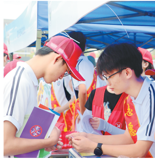
陵水开展“健康人生 绿色无毒”禁毒宣传进学校活动。