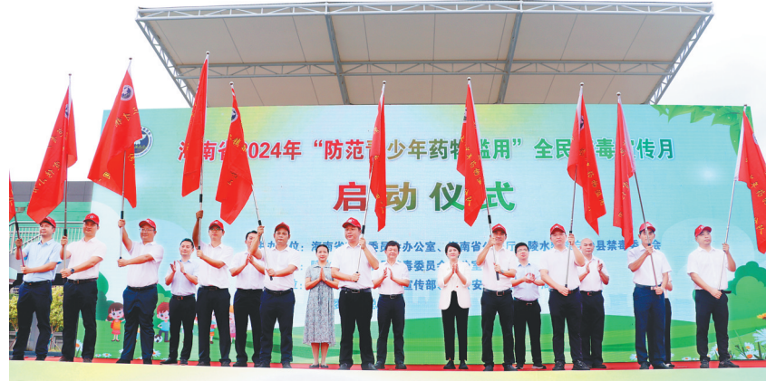
陵水为11个乡镇“预防青少年药物滥用”宣讲小分队出征授旗。校活动。

“四升”:戒断三年未复吸人员大幅上升,戒断三年未复吸人员同比2017年上升143%;社区戒毒社区康复执行率达100%;广大群众对禁毒工作满意度达95%以上,安全感、幸福感和获得感不断增强;全民禁毒知晓率大幅上升,广大群众特别是青少年学生毒品知识普及率达100%。