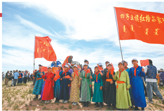
四子王旗的小学生们在着陆现场庆祝嫦娥六号返回器着陆。