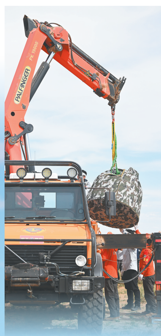
吊装回收返回器。

6月25日14时7分，嫦娥六号返回器携带来自月背的月球样品安全着陆在内蒙古四子王旗预定区域，探月工程嫦娥六号任务取得圆满成功。