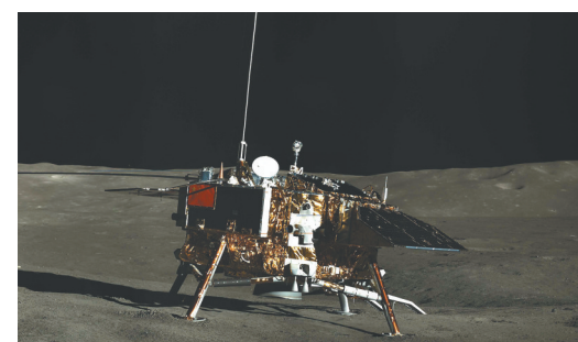
嫦娥四号着陆器彩色全景图。

正如探月工程首任总设计师孙家栋所说：“从‘嫦娥一号’飞向月球的那一刻起，我就知道，飞向月球的大门一经打开，深空探测的脚步就不会停止。”（新华社北京6月25日电）