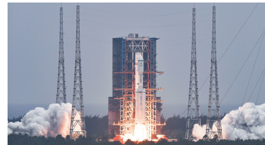
2024年3月20日8时31分，探月工程四期鹊桥二号中继星由长征八号遥三运载火箭在中国文昌航天发射场成功发射升空。