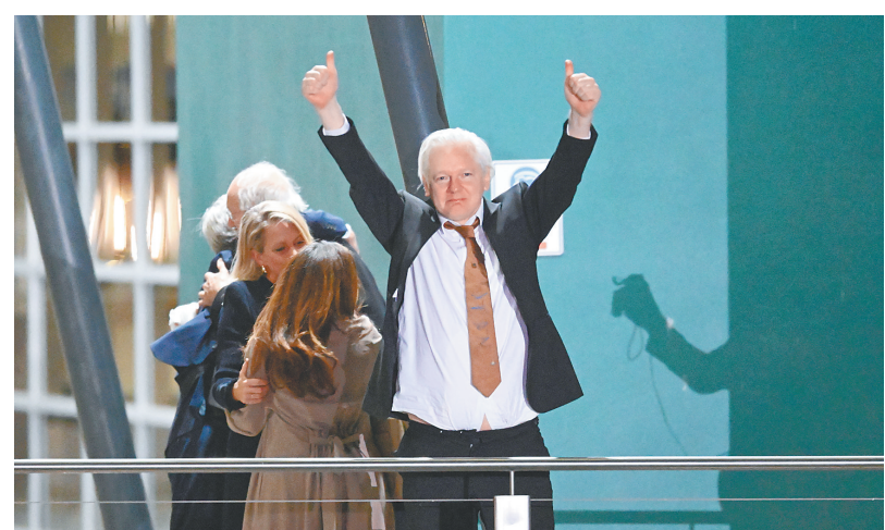
6月26日,“维基揭秘”网站创始人阿桑奇(右一)抵达澳大利亚堪培拉机场后向支持者致敬。

新华社华盛顿6月25日电(记者邓仙来 熊茂伶)当地时间26日,“维基揭秘”网站创始人阿桑奇在位于美国马里亚纳群岛首府塞班岛的美国联邦法院对一项违反美国间谍法的重罪认罪。