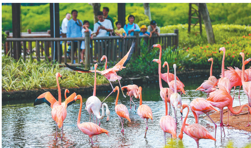
游客在澄迈红树林湿地公园观火烈鸟。