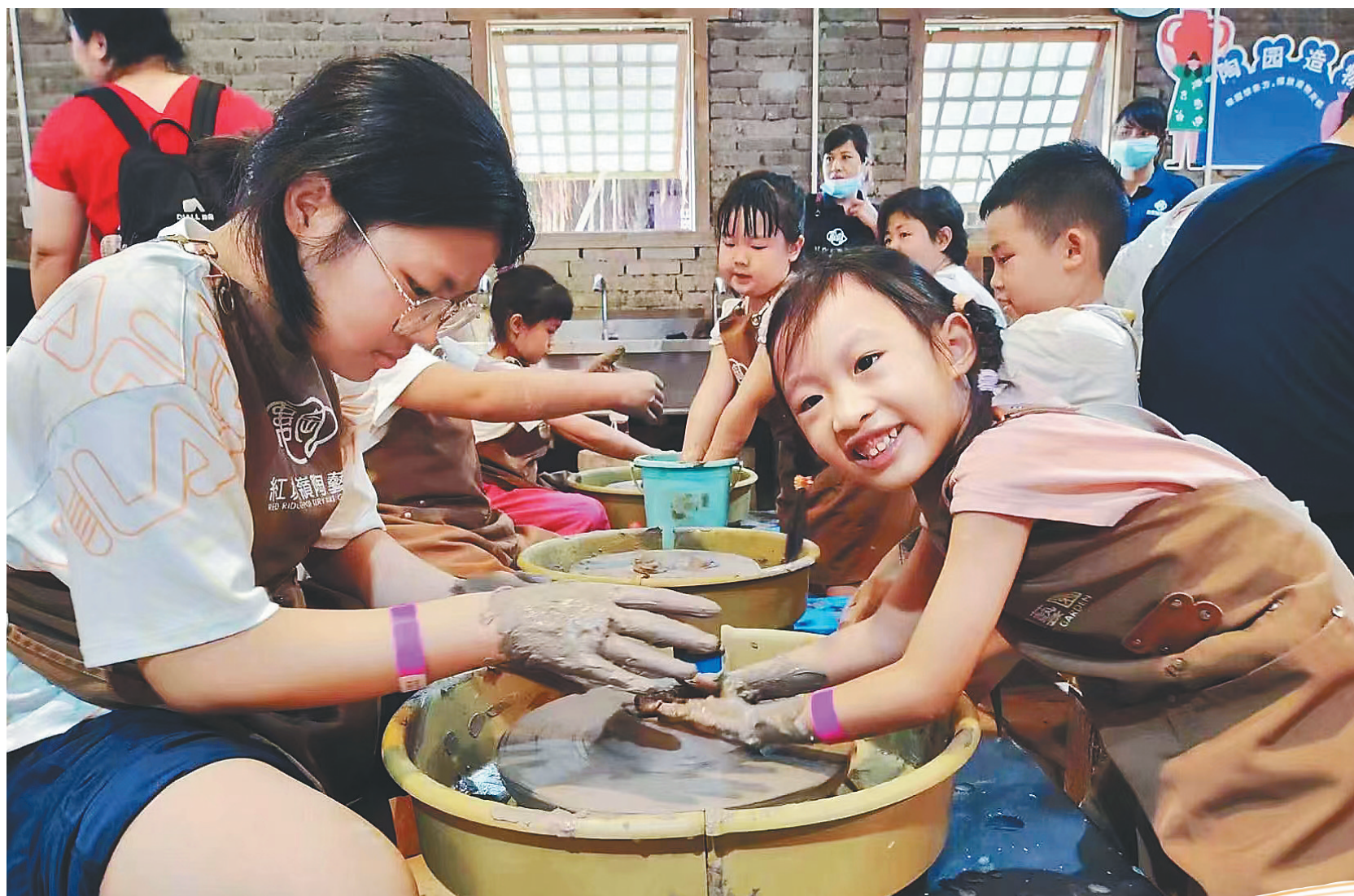
◀游客在澄迈红坎岭陶艺园内制作陶器。 ▶游客行走在澄迈福山镇洋道村乡间小路，感受大自然的 魅力。