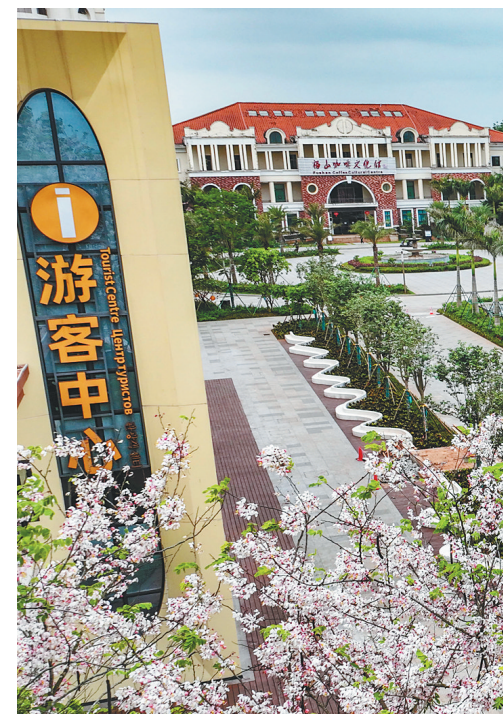
澄迈福山咖啡文化风情镇。