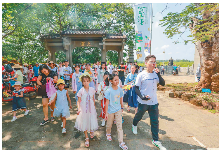
游客在澄迈老城隍庙社村参加乡村艺术活动。

国社村至今已有将近900年的历史，是海南姜姓的主要聚居地，是姜氏走向岛内多地的始发站，也是苏东坡学生姜唐佐的故里。2021年，国社村以苏东坡与姜唐佐师生关系为基础，规划建设“东坡唐佐纪念馆”。