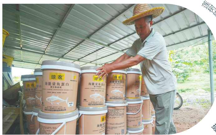
位于抱由镇美村一榴莲基地，工作人员查看肥料。