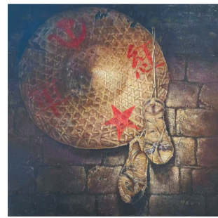
油画《艰苦岁月》。吴坤友 作