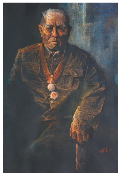
色粉画《老战士》。符祥康 作