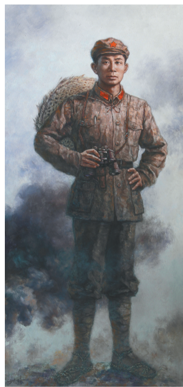
油画《冯白驹将军》。吴地林 作