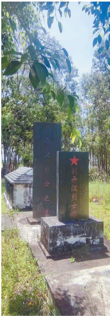
刘开汉烈士墓(衣冠冢)。

这份一号烈士证的主人是海南早期的中国共产党人之一，琼岛西部革命启蒙者——刘开汉。刘成业是他的孙子。