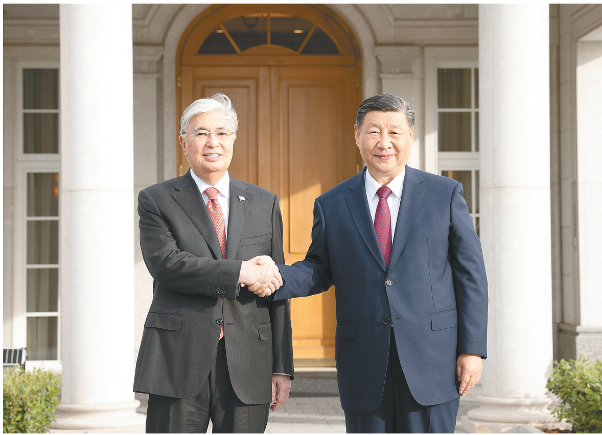
当地时间七月二日晚，国家主席习近平应邀同哈萨克斯坦总统托卡耶夫共进晚餐，在愉快温馨的环境中就中哈关系和共同关心的问题进行了亲切友好的交流。这是习近平同托卡耶夫握手。

新华社阿斯塔纳7月2日电 当地时间7月2日晚，国家主席习近平应邀同哈萨克斯坦总统托卡耶夫共进晚餐，在愉快温馨的环境中就中哈关系和共同关心的问题进行了亲切友好的交流。